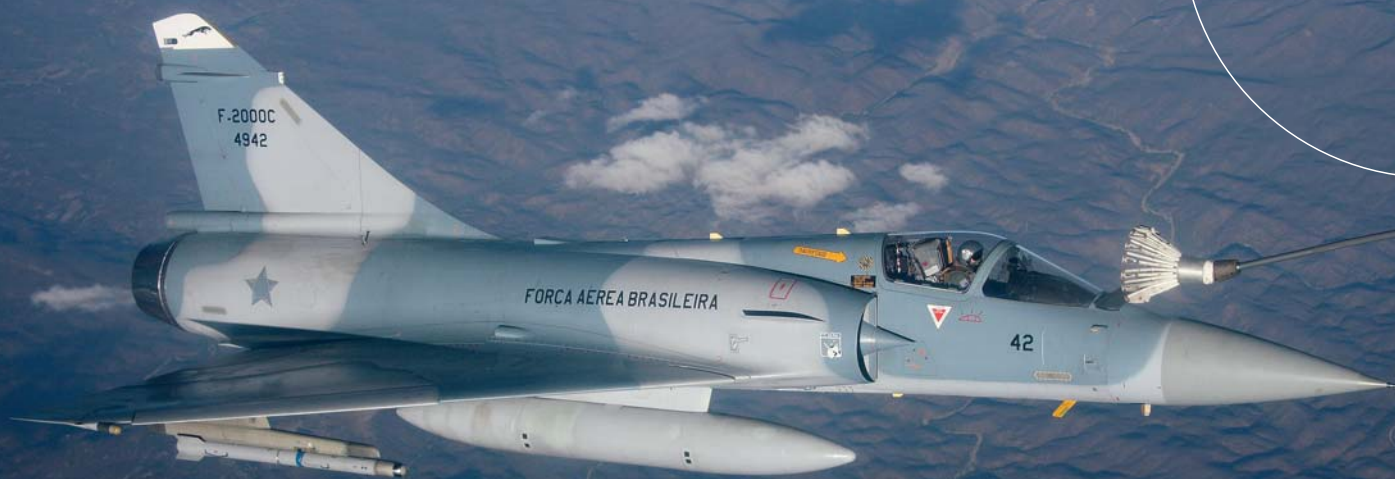
➔ Mirage 2000C της FAB ενώ ανεφοδιάζεται σε καύσιμα από αεροσκάφος τάνκερ KC-137 της Αεροπορίας της Βραζιλίας.