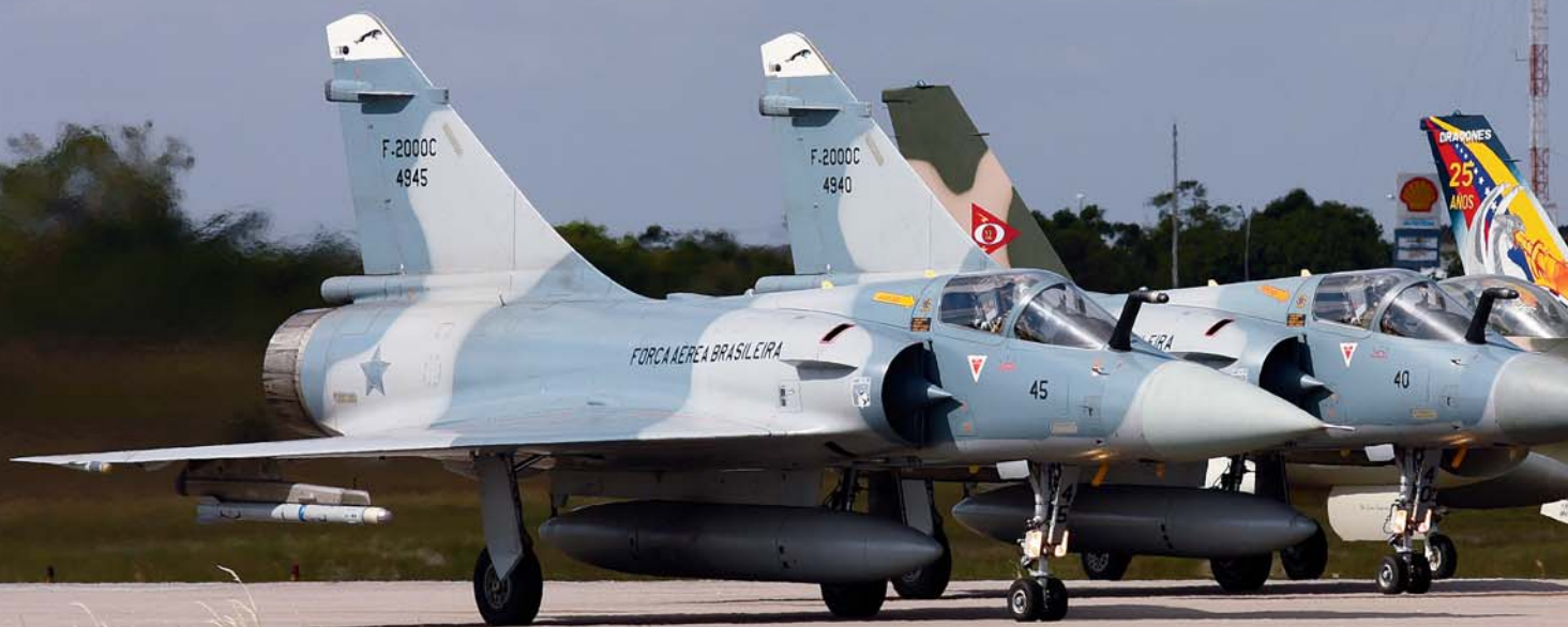
➔ Παράταξη αεροσκαφών Mirage 2000C της Αεροπορίας της Βραζιλίας με F-16A της Βενεζουέλας ενώ ετοιμάζονται για απογείωση, κατά τη διάρκεια των πιέσεων εξοικείωσης που προηγήθηκαν της άσκησης CRUZEX.