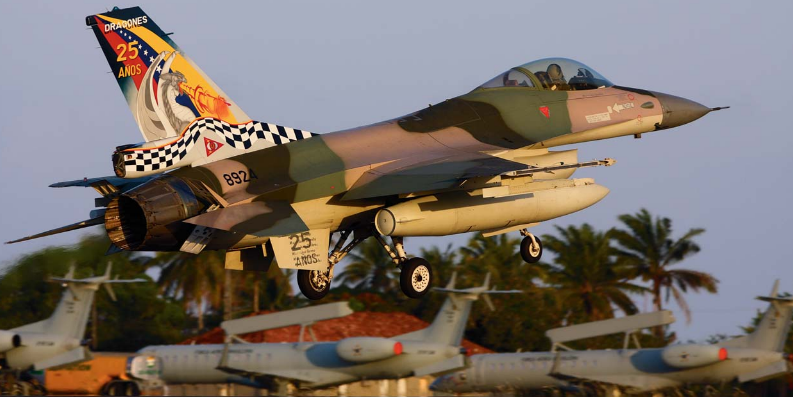
Έξι συνολικά F-16A Block 15 της Αεροπορίας της Βενεζουέλας πήραν μέρος στην CRUZEX IV. Η Βενεζουέλα απέκτησε την περίοδο 1982-84 24 συνολικά αεροσκάφη του τύπου, σήμερα όμως πιστεύεται πώς λιγότερο από τα μισά είναι σε επιχειρησιακή κατάσταση.

μπο Γκράντε. Παρά τις φήμες για τη μη συνέχιση της CRUZEX, η Αεροπορία της Βραζιλίας ανακοίνωσε στις αρχές του 2008 ότι η επόμενη άσκηση CRUZEX IV είχε προγραμματιστεί για το Νοέμβριο του ίδιου έτους.